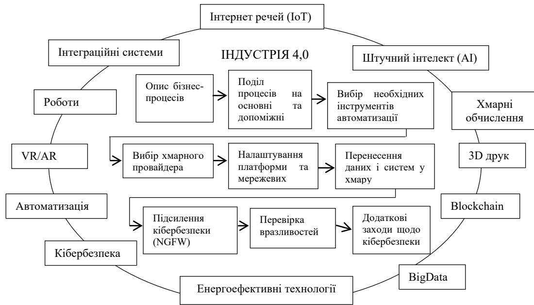
Рис. 2. Процес цифрової трансформації підприємств в умовах Індустрії 4.0