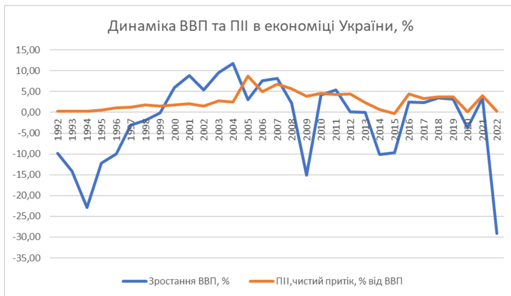
Рис. 1. Динаміка ВВП та прямих іноземних інвестицій в економіці України, %, 1992–2022 рр.

Значна волатильність спостерігається і у динаміці рівня інфляції та зовнішнього боргу. Потреба фінансування військових витрат сприяє значному зростанню зовнішнього боргу та інфляції. Світовий Банк ще не подає дані за 2022–2023 рр., проте ми можемо припустити, що в умовах війни ця тенденція лише посилиться.