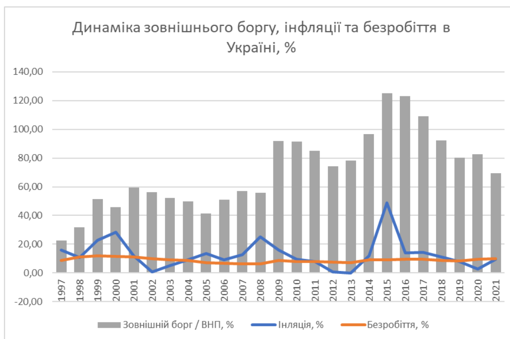
Рис. 3. Динаміка зовнішнього боргу, інфляції та безробіття в Україні, %, 1997–2021 рр.

Ще однією групою показників, які пояснюють динаміку прямих іноземних інвестицій, є показники