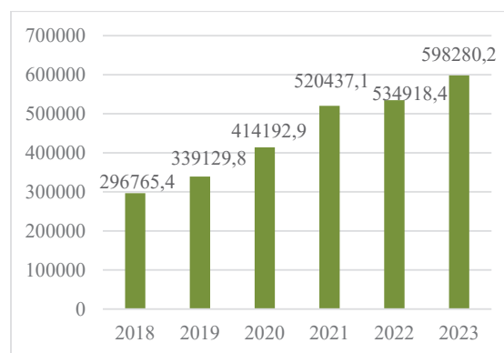
Рис. 2. Активи визнаних ІСІ в управлінні, млн грн