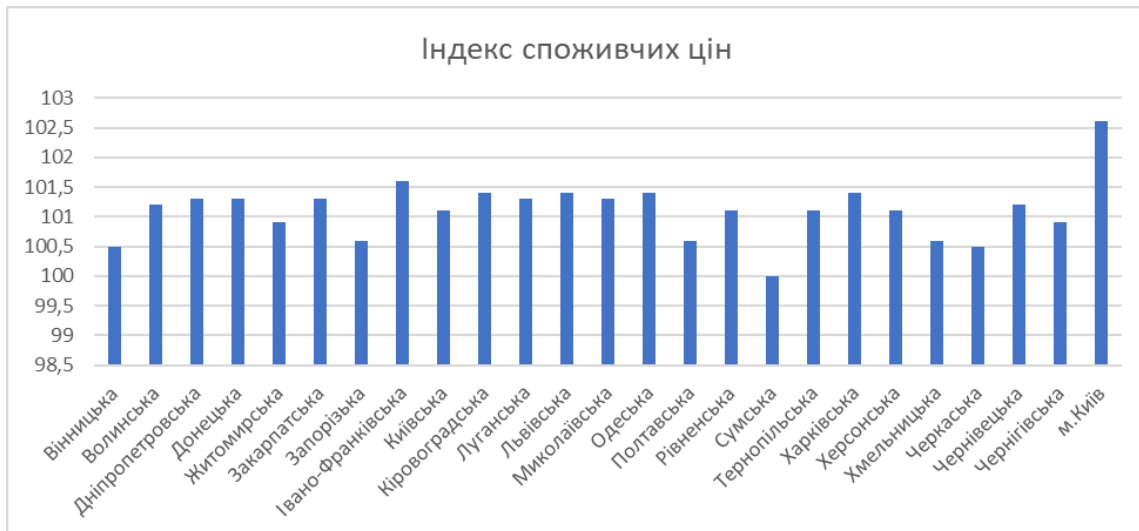
Рис. 3. Динаміка споживчих цін по регіонах України (березень 2024 р.)