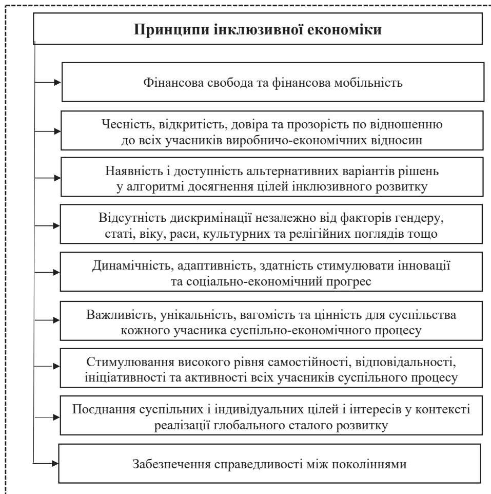
Рис. 2. Принципи інклюзивної економіки

4. Соціально-культурний розвиток. Розширення прав і можливостей всіх верств населення світу шля-