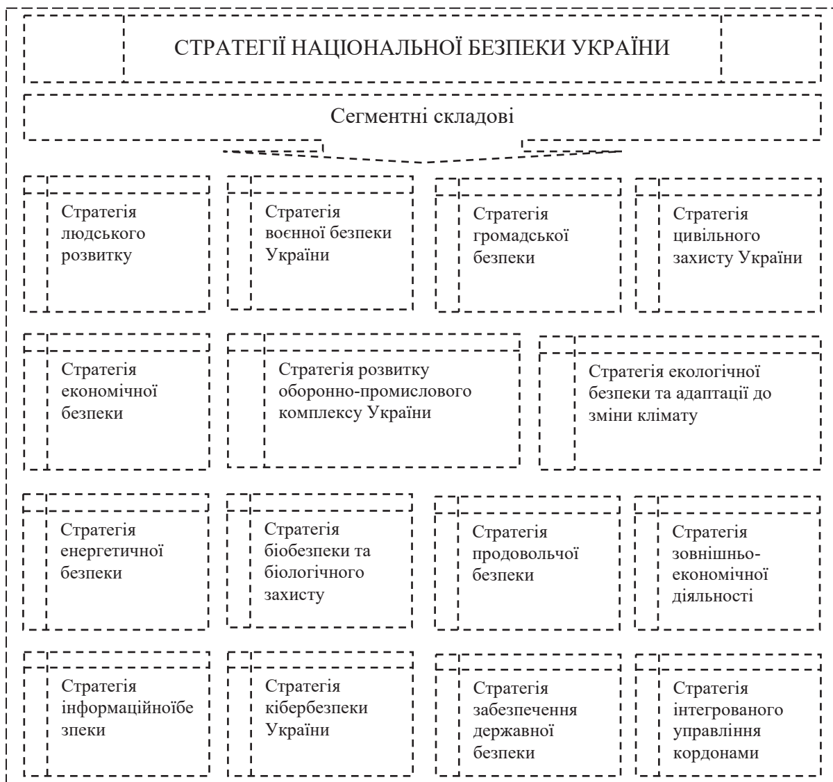
Рис. 1.1. Сегментні складові, які визначатимуть шляхи та інструменти реалізації Стратегії національної безпеки України