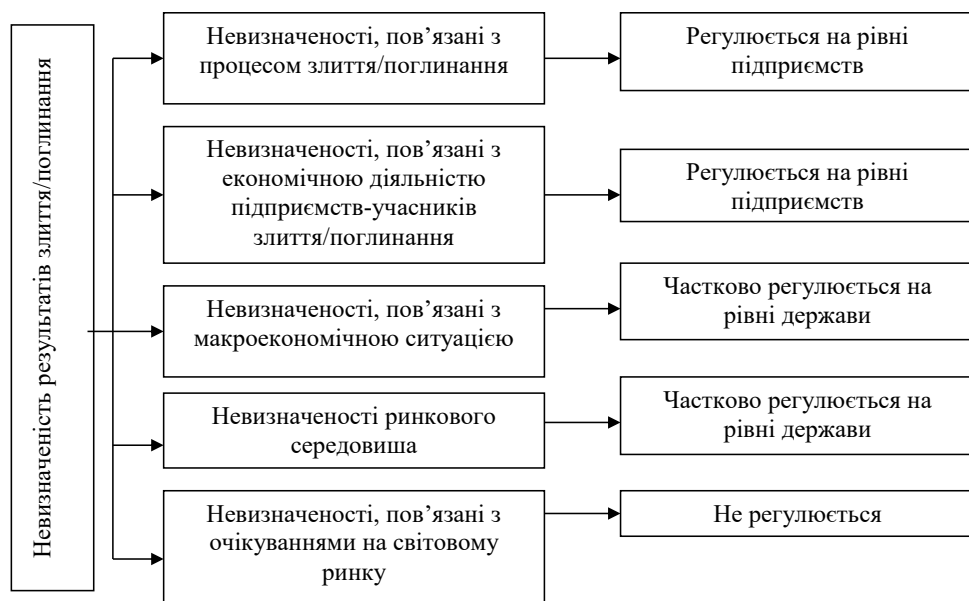
Рис. 3. Можливості врахування невизначеності результатів процесу злиття / поглинання

Угоди злиття та поглинання реалізуються у складному динамічному середовищі, для якого характерне існування різноманітних чинників. Кожен вид невизначеності щодо реалізації угод процесів злиття і поглинання та отримання відповідних ефектів взаємодії потребує всебічного врахування та опанування при укладенні відповідної угоди, що дасть змогу досягти позитивних результатів від укладення угоди для кожного з учасників, а також матиме змогу забезпечити урегульованість самої угоди при її практичній реалізації.