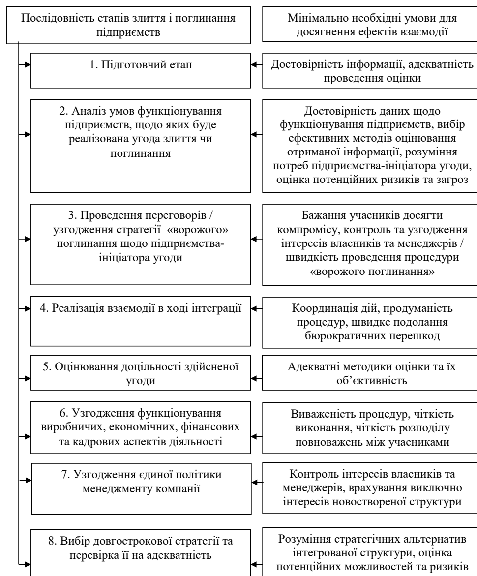
Рис. 2. Основні етапи реалізації угоди злиття і поглинання при орієнтації на досягнення ефектів взаємодії учасників

Послідовність досягнення ефектів взаємодії при злитті і поглинанні підприємств містить: визначення