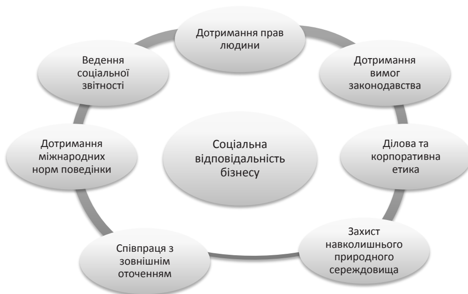
Рис. 1. Напрями соціальної відповідальності бізнесу

Варто відзначити, що особливістю українських сільськогосподарських товаровиробників є те, що вони мають змогу виробляти екологічно чисту та органічну продукцію, яка користується високою популярністю