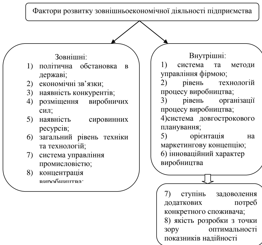
Рис.3. Система факторів розвитку зовнішньоекономічної діяльності [1]

Залежно від місця виникнення фактори розвитку зовнішньоекономічної діяльності підприємства поділяють на внутрішні та зовнішні (рис. 3).