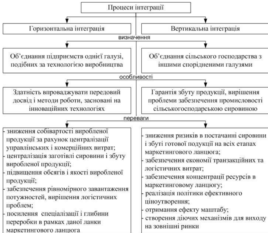
Рис. 2. Процеси інтеграції при кооперуванні

При кооперації можна забезпечити оптимальну концентрацію виробництва, зміцнити зв'язки між учасниками кооперації, підвищити продуктивність праці і знизити собівартість продукції. Процеси горизонтальної інтеграції, які виникають при кооперуванні, дозволяють укрупнити виробництво, поглибити його спеціалізацію і розподіл праці. При вертикальній інтеграції збільшуються виробничі потужності, зміцнюються виробничо-економічні зв'язки між партнерами (рис.2).